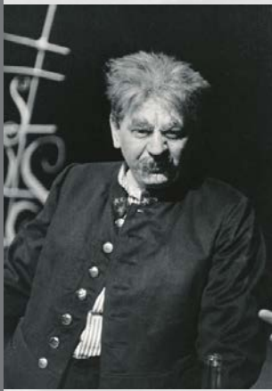
Netopýr (1961) – jako Frosch

„Jak říkám, vyprávění téhle sorty vtipů (píjáckých anekdot, pozn. red.) mi tak trochu pošramotilo pověst. Ale také režiséri mě brzy začali považovat za obzvlášť způsobilého pro postavy se zarudlým nosem. Hrál jsem je s chutí. Třeba vojína Loriota v Mamzelle Nitouche nebo vachmajstra Frosche v operetě Netopýr.“