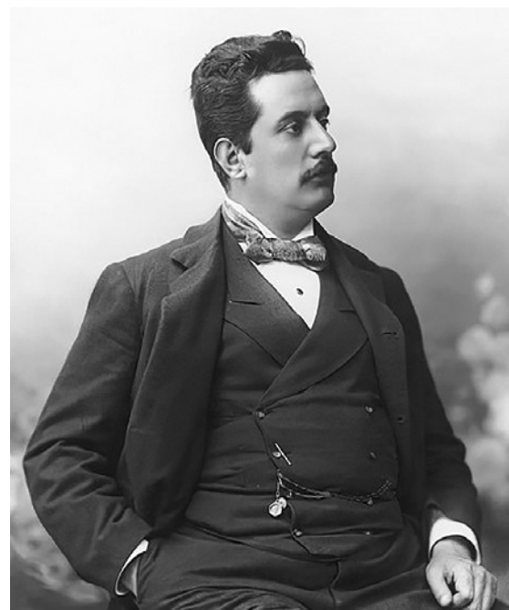
Giacomo Puccini kolem roku 1900

tragickému konci. Přes divácký úspěch dramatu, který krom nesčetného množství repríz po celém světě nepotřebuje další důkaz, nebyla odborná veřejnost hrou nikterak uchvávena. G. B. Shaw se na její adresu ku příkladu vyjádřil, že jde o „bezduchý stín krváku“ a později sarkasticky dodal: „Byla by z ní fajn opera“.