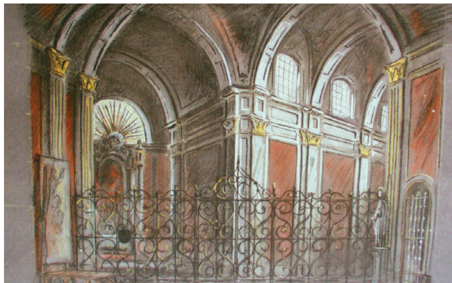
Návrh scény Václava Gottlieba k 1. dějství inscenace z roku 1950

Tosca se na ostravském jevišti objevila poprvé bezmála před 100 lety 19. května 1921. Od té doby se stejně jako na všech světových scénách zařadila k stálícím vracejícím se na repertoár divadla s přibližnou periodou jedné dekády a na jejím inscenování se pokaždé podílely ty nejvýraznější osobnosti formující život našeho divadla.