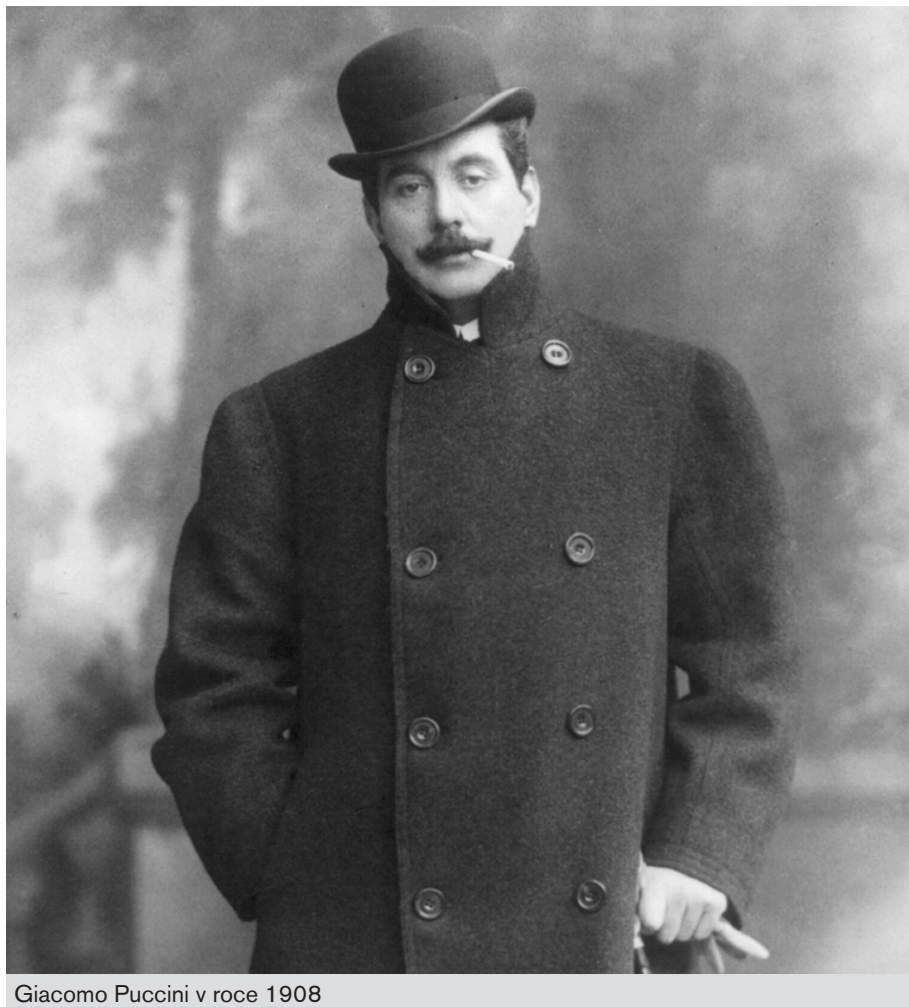
Giacomo Puccini v roce 1908