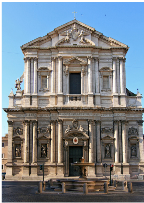
Barokní průčelí kostela Sant'Andrea della Valle

Výstavba kostela započala v roce 1590 podle návrhů architektů Giacomo della Porta a Piera Paola Olivieriho pod patronací kardinála Gesualda di Conzi. Po jeho smrti záštitu přebíral kardinál Alessandro Peretti di Montalto a po obnovení prací v roce 1608 získala stavba od slavného architekta Carla Maderna nový grandióznější design směřující k dnešní barokní podobě. Vyhotovením interiérových fresek byli pověřeni dva Carracciho studenti Giovanni Lanfranco a Domenico Zampieri – známý pod jménem Domenichino. Práce na interiéru dokončili v roce 1650 a výsledek se na několik následujících desetiletí stal vzorem chrámové výzdoby. Kapli rodiny Attavanti bychom v kostele sice hledali marně, přesto ale jeho četné