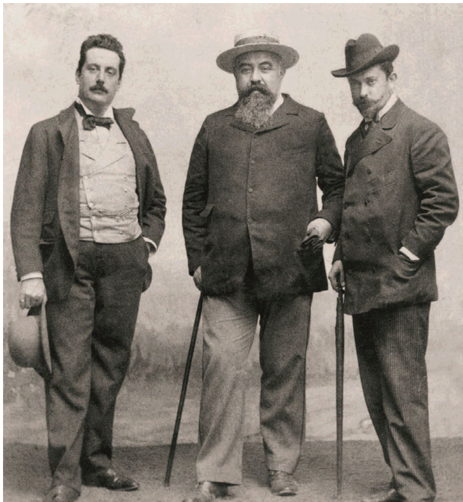
Giacomo Puccini se svými libretisty Giuseppem Giacosou a Luigim Illicou

Děj dramatu se odehrává v Římě ve dnech 17. a 18. června 1800 na historickém pozadí vpádu francouzských vojsk vedených Napoleonem do Itálie. Klíčovou událostí je pak zejména bitva u Marenga, s jejímž domnělým i skutečným výsledkem jsme v průběhu hry obeznámeni. Na tomto pozadí se mezi trojicí hlavních postav Floriou Toscou, Mariem Cavaradossim a Baronem Scarpou odvíjí příběh lásky, vášně a intrik směřující k nevyhnutelné