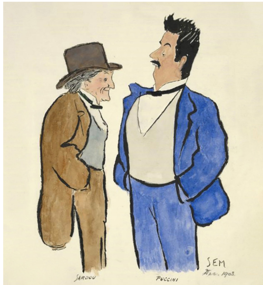
Victorien Sardou a Giacomo Puccini na karikatuře Georgese Goursata

V lednu 1899 se Puccini sešel v Paříži se Sardouem a obdržel od něj připomínky k úpravám textu. Zamýšlená verze závěru opery, ve které Tosca zešílí, avšak zůstává naživu, byla pro dramatika absolutně nepřijatelná. Resumé setkání tedy bylo: Tosca musí zemřít! I když poslední stránka partitury nese datum 29. září 1899, Puccinimu scházelo stále dokončit pár detailů. Jedním z nich byla píseň pasáčka ze začátku 3. dějství, pro kterou