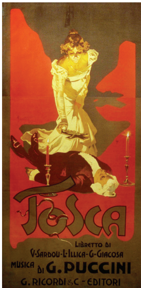
Titulní strana prvního vydání klavírního výtahu opery