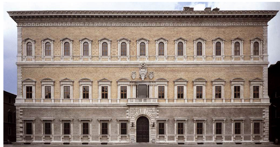
Průčelí paláce Farnese

Od roku 1936 je palác sídlem francouzské ambasády.