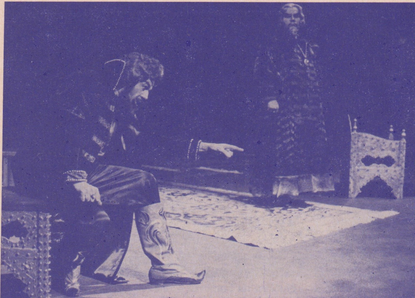
M. P. Musorgskij: BORIS GODUNOV — opera v Divadle Zd. Nejedlého