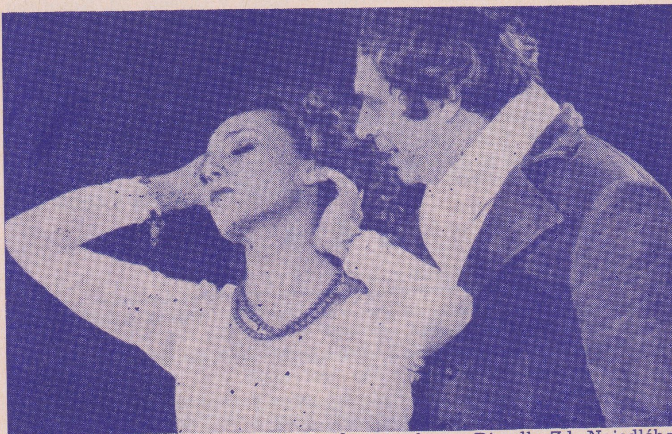
F. G. Lorca: MARIANA PINEDOVÁ — činohra v Divadle Zd. Nejedlého