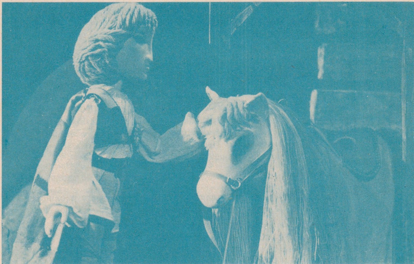
S. Lichý: UDATNÝ PRINC BAJAJA — uvádí loutková scéna.

V Divadle loutek zahajuje loutková scéna v neděli 2. října pravidelná nedělní dopolední představení pro děti i pro zájemce z řad dospělých. Začátky představení vždy v 10 hodin, vstupenky je možno zajistit v ústředním předprodeji nebo přímo před začátkem představení v Divadle loutek.