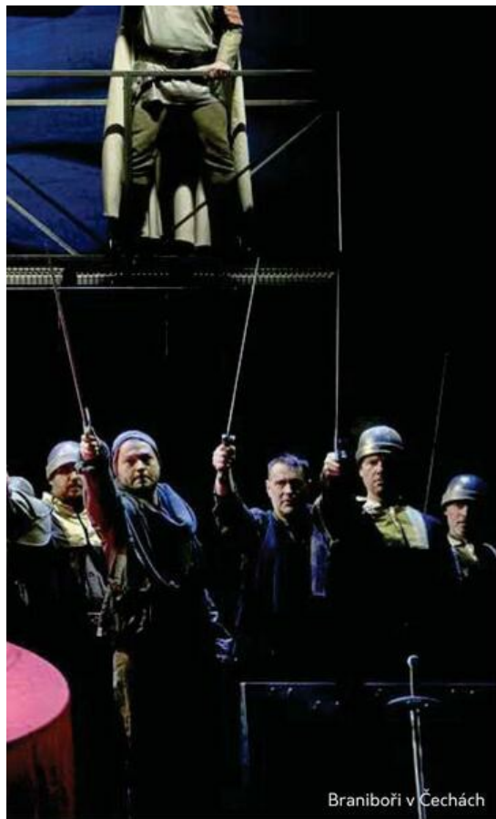
Braniboři v Čechách